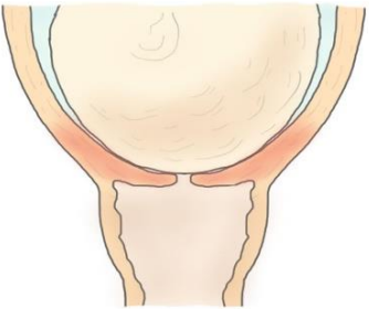
Illustrasjon: Eline Skirnisdottir Vik

አንዳንድ ሴቶች ምጥቸው እንዲፋጠን ወይም እንዲጀምር በሚደረግበት ሂደት በጣም ይደክማሉ። እንቅልፍ ማጣትና ህመም የበዛበት የማህፀን መኮማተር በጣም ከባድ ሊሆንብሽ ይችላል። ስለሆነም በቀን ውስጥ እንኳን ቢሆን ጥሩ ዕረፍት ማድረግ ወይም መተኛት አስፈላጊ ነው። ተጨማሪ ኃይል እንድታገኙ ቀለል ያሉ ምግቦች መመገብና ብዙ ውኃ መጠጣት አለብሽ።