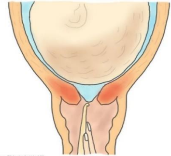
Illustrasjon: Eline Skinnisdottir Vik

የማሕጸን ጫፍ ቢሳሳም ምጡ ግን በትክክል ካልጀመረ አዋላጅዎ ወይም ሐኪሙ የእንሽርት ውኃን ሸፍኖ የያዘውን የመምብራና ሽፋን ከፕላስቲክ በተሰራ ቀጭን ሹል ነገር መውጋት እንዲፈስ ያደርጋል፤ ብዙዎች ከዚህ በኋላ የጠነከሩ የሚሄድ የማሕጸን መኮማተር ይሰማቸዋል። ይህ እንደ መደበኛ የሴት ብልት ምርመራ የሚሰማው ስሜት ይኖረዋል። ለህፃኑ ግን ህመም የለውም። ከዚህ በፊትም ሆነ በኋላ የልጁ የልብ እንቅስቃሴ ይመዘገባል።