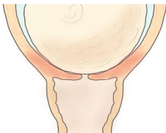
Jaantus 2aad afka ilmagaleenka/ aan qaan gaarin