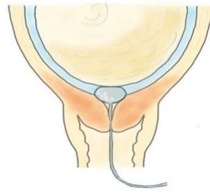
Illustrasjon: Eline Skirnisdottir Vik

እቲ ካታተር ምስ ኣተወ ነዊሕ ከይጸንሐ፡ ናይ ማህጸን ምጭብባጥ ክስምዓኪ ክጅምር እዩ። እቲ ምጭብባጥ ማህጸን እተፈላለዮ ጻዕቅን ብርታዕን ቃንዛን ክህልዎ ይኽእል እዩ። ንእተወሰነ ሰዓታት ክጸንሕ ይኽእል እዩ። ኣብ ገሊኡ እዋናት፡ እዚ ናይ ማህጸን ምጭብባጥ ቅልውላው ሕርሲ ከምኡውን ሕርሲ ከጀምር ይኽእል እዩ።