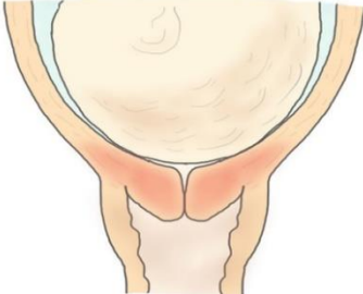
Illustrasjon: Eline Skirmisdottir Vik

እቲ እንጥቀም ሜላ ኣብቲ ክሳብ ማህጸንኪ ምርቃቕን ዘይምርቃቕን እተመርኩሰ እዩ። ኩሉ ሳዕ እቲ ሓኪም ክትወልዱ ቀሪብኪ እንተ ኳንኪ ምእንቲ ኽፈልጥ፡ ብርሕሚ ኣቢሉ ብዝግበር ቢሾፕ ስኮር ዝበሃል መርመራ ክገብረልኪ፡ ከምኡውን ንውሓትን ኣቀማምጥን ምርቃቕን ክሳብ ማሕጸንኪ ክግምግምን ክኸፈት እንተ ጀሚሩ ክምርምርን እዩ። እቲ ዕሽል በዩናይ ሸነኽ ጎሎኺ ከም ዘሎ እውን ክርኢ እዩ። ድሕሪኡ፡ እቲ ሓኪም እንታይ ዓይነት ሜላ ሕርሲ ከም ዝሓይሽ ክውስን እዩ።