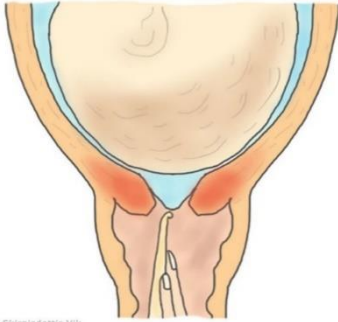
Illustrasjon: Eline Skinnisdottir Vik

ድርኪት ብኣምንዮቶሚ/ምጭብባጥ ማህጸን ዘቀላጥፍ ማይ ሓይሊ እቲ ክሳድ ማህጸን ረቐቐ ከሎ ሕርሲ ግን ብልክዕ እንተ ዘይጀሚሩ፡ እታ ሞሕረሲት ወይ ሓኪም ነቲ ኣምንዮቲክ ፈሳሲ ሸፊኑ ዝሓዘ መምብራና ብቐጢን በሊሕ ፕላስቲክ ገይራ ብምንኳል እቲ ኣምንዮቲክ ፈሳሲ ከም ዝወጽእ ትገብሮ፤ ብዙሓት ጥንሳት ድማ ድሕረዚ ማሕጸንን ብብርቱዕ ክጨባበጥ ይጅምር እዩ። እቲ ስምዒት ከምቲ ብርሕሚ ኣቢሎ መርመራ ክግበረልኪ ኹሎ ዝስምዓኪ ስምዒት እዩ። ነቲ ዕሽል ድማ ዋላ ሓንቲ ኣይጎድኡን እዩ። ቅድምን ድሕርን እዚ ስጉምቲ፡ ህርመት ልቢ ናይቲ ዕሽል ክዕቀን እዩ።