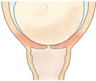
Illustrasjon: Eline Skirnisdottir Vik

ገለ ካብተን ሕርሰን ብድርኪት ወይ ብምድፍፋእ ክጅምር ዝግበረለን ጥኑሳት፡ ኣዝዮን ይደኽማ እዮን። ድቃስ ምስኣንን ቃንዛ ዝበዝሐ ምጭብባጥ ማህጸንን ኣመና ከቢድ ክኸውን ይኽእል እዩ። ስለዚ፡ ብዝከኣል መጠን፡ ዋላ እውን ቀትሪ እንተ ኹነ ጽቡቕ ዕረፍቲ ምግባር ወይ ምድቃስ ኣገዳሲ እዩ። ሓይሊ ምእንቲ ክትረኽቢ ድማ ፈኩስ ምግባር ክትበልዕን እኹል ማይ ክትሰትይን እውን ኣሎኪ።